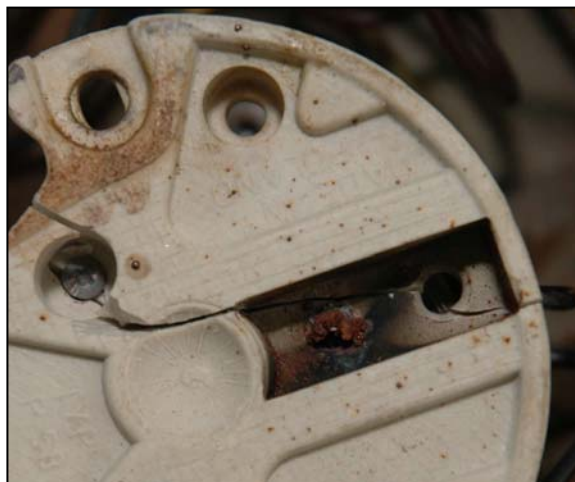
Rys. 1 Uszkodzenie oprawki na skutek zastosowania źródła światła (żarówki) o zbyt dużej mocy.

Oczywiście niektóre z wymienionych powyżej modyfikacji mogą być dopuszczalne w Instrukcji obsługi producenta, jednakże nie wszyscy producenci potrafią być tak przewidujący i prognozować potrzeby użytkowników.