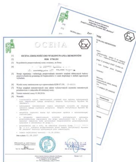
Rys. 3 Przykład dokumentu „Ocena zdolności do wykonywania remontów.”