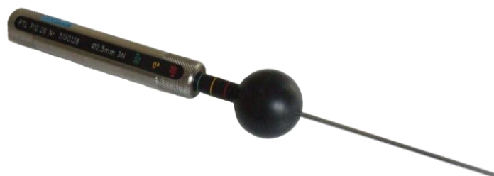
Rys. 4 – Próbnik dostępu – pręt o średnicy 2,5mm, wykorzystywana do sprawdzania stopnia ochrony przed dostępem do części niebezpiecznych oraz przed wnikaniem obcych ciał stałych – pierwsza cyfra charakterystyczna – 3.