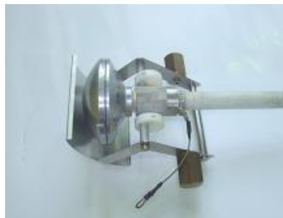
Rys. 10 – Końcówka natryskująca do badania stopni ochrony IP X3 oraz IP X4