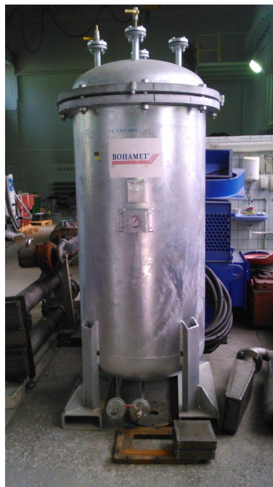
Rys. 12 – Zbiornik do prób zanurzeniowych - badania stopni ochrony IP X7 oraz IP X8