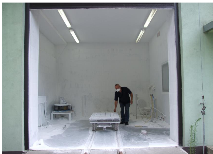
Rys. 8 – Wnętrze większej komory pyłowej