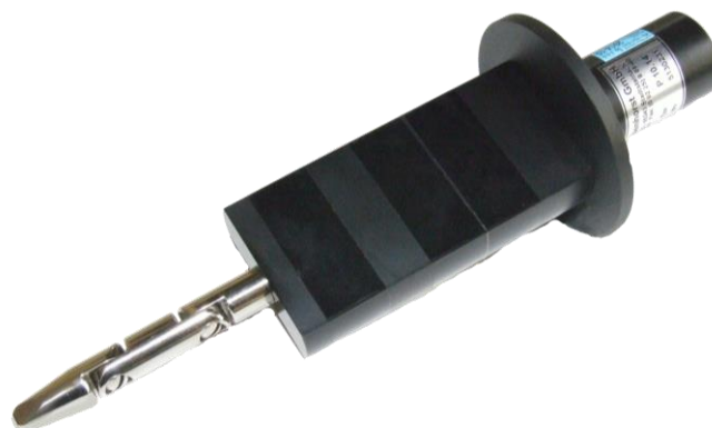
Rys. 3 – Próbnik dostępu - przegubowy palec probierczy o średnicy 12mm i długości 80mm, wykorzystywana do sprawdzania stopnia ochrony przed dostępem do części niebezpiecznych – pierwsza cyfra charakterystyczna – 2.