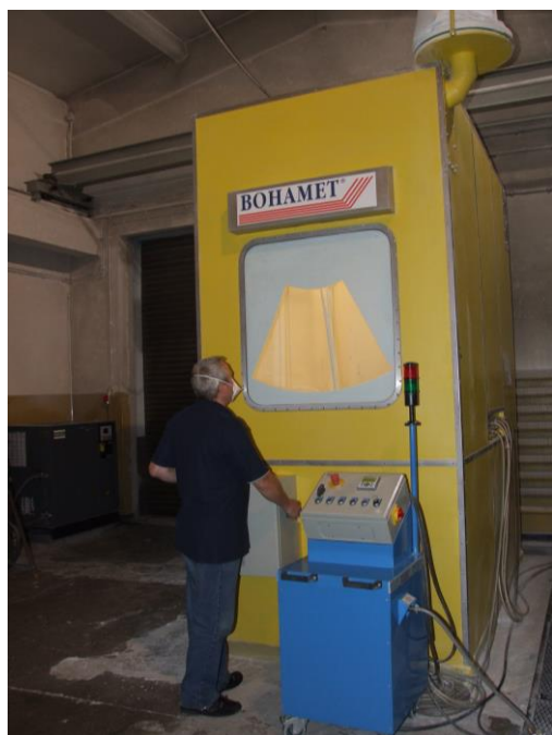
Rys. 6 – Mniejsza komora pyłowa, wraz z pulpitem sterującym układem dyspersyjnym

gabaryty obudów badanych w dużej komorze (Rys. 8) wynoszą 2800 x 2800 x 4200 mm. Jako pył stosuje się talk o granulacji umożliwiającej przejście przez sito o oczkach kwadratowych, wykonanych z drutu o średnicy 50 \mu m i odstępnie między drutami 75 \mu m. Na każdy metr sześcienny komory przypada 2kg talku. Pył ten w trakcie badania utrzymywany jest w stanie zawieszenia, do czego wykorzystuje się wentylatory zainstalowane wewnątrz komór, współpracujące z układem dyspersyjnym.