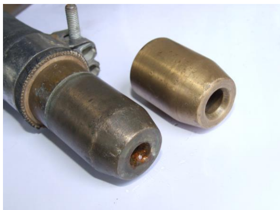
Rys. 11 - Dysze probiercze 12,5mm oraz 6,3mm