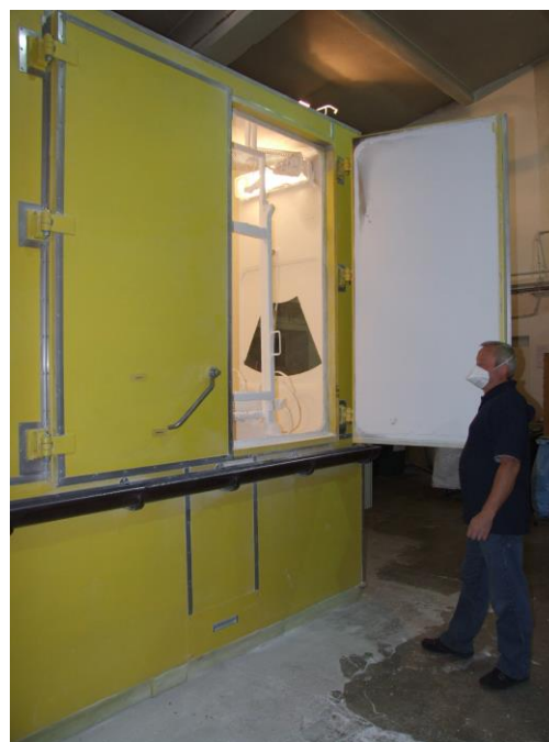
Rys. 7 – Mniejsza komora pyłowa