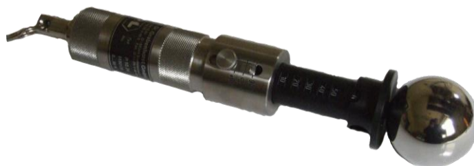
Rys. 1 – Próbnik dostępu - kula o średnicy 50mm, wykorzystywana do sprawdzania stopnia ochrony przed dostępem do części niebezpiecznych oraz przed wnikaniem obcych ciał stałych – pierwsza cyfra charakterystyczna – 1.

Przy sprawdzaniu możliwości dostępu do części niebezpiecznych oraz wnikania ciał stałych do wnętrza obudowy, wykorzystuje się próbники dostępu, przedstawione na poniższych fotografiach, wraz z opisem ich zastosowania: